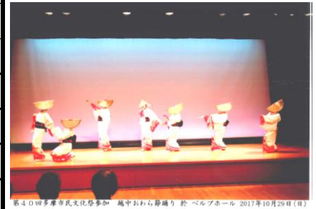
第40回多摩市民文化祭参加 越中おわら節踊り 於 ベルブホール 2017年10月29日(日)